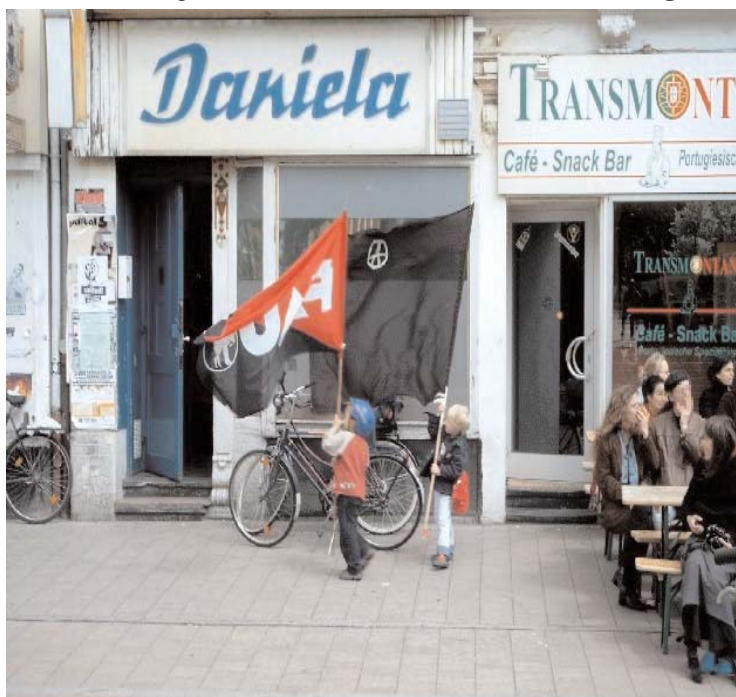
oben: Junge Anarchisten und Sozialrevolutionäre am Rande der Demo in HH

zog zum Fischmarkt, um dort gemeinsam mit der SPD-Stadtprominenz das ein oder andere Fischbrötchen zu mampfen. Der revolutionäre Block , der rein äußerlich einem schwarzen Block glich, ging quasi als eigenständige, ca. 500 Menschen umfassende Demo, mit eigenen Front- und Seitentranspisen sowie Sprechchören, mit etwas Abstand hinter